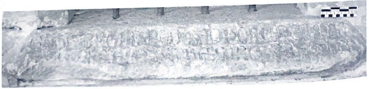
Fig. 85. Inscripción del nicho.