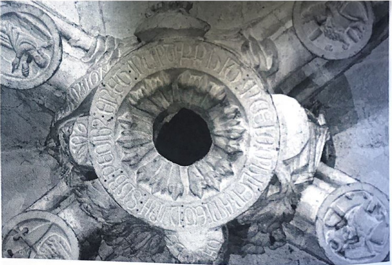
Fig. 90. Inscripción de la clave del coro.