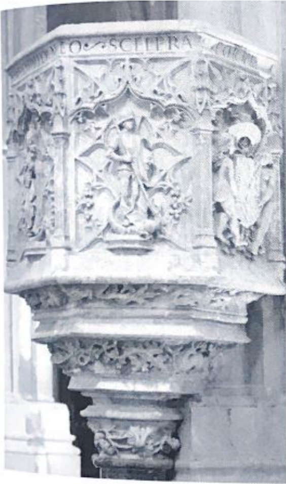
Fig. 92. Πύλιτο de la catedral de El Burgo de Osmá.