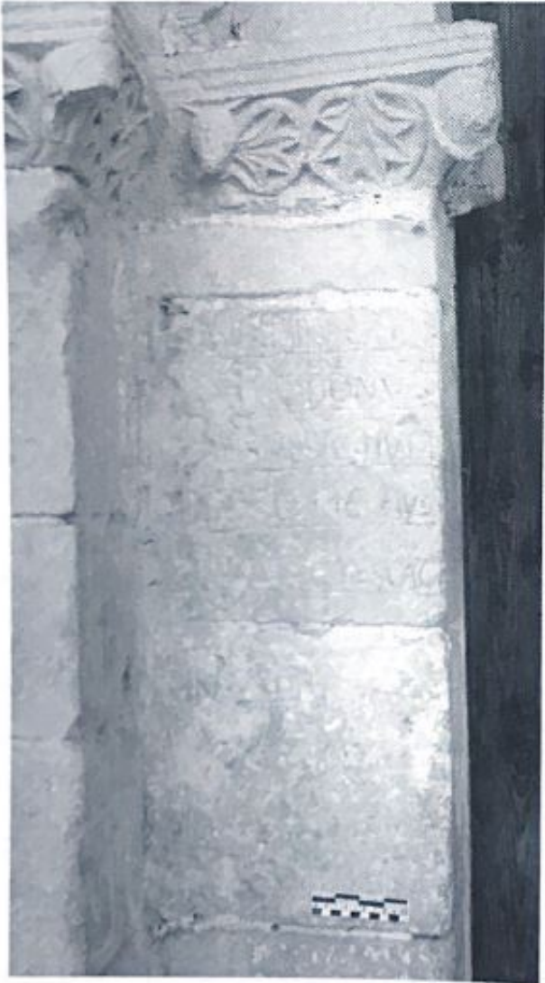
Fig. 95. Inscripción del abad Iohannes en la jamba izquierda de la puerta.