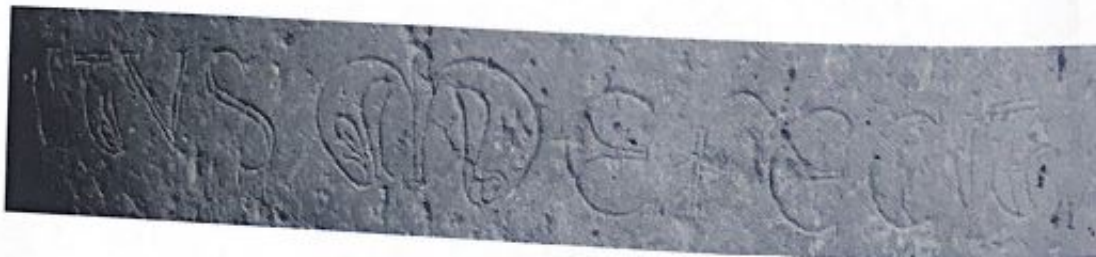
Fig. 106. Detalle de la inscripción.