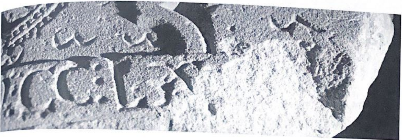
Fig. 109. Detalle de los ordinales sobre la parte final de la inscripci3n.