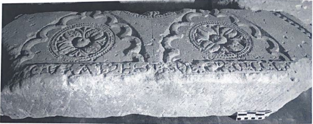
Fig. 107. Inscrpción del eclipse procedente de San Nicolás de Bari