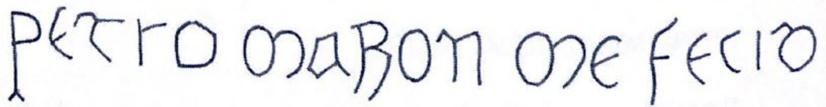
Fig. 125. Dibujo de la inscripción.