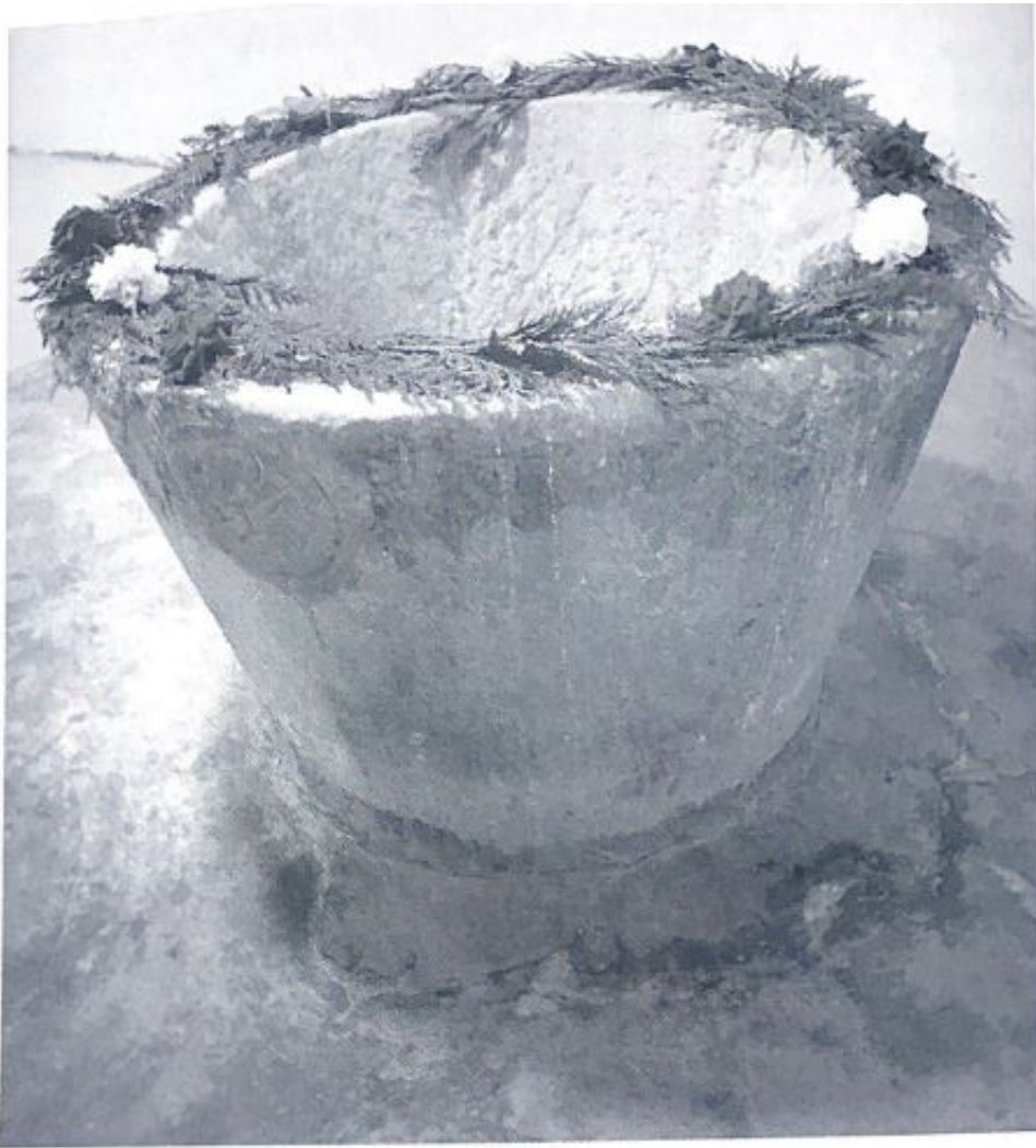
Fig. 123. Pila bautismal de Velilla de la Sierra.