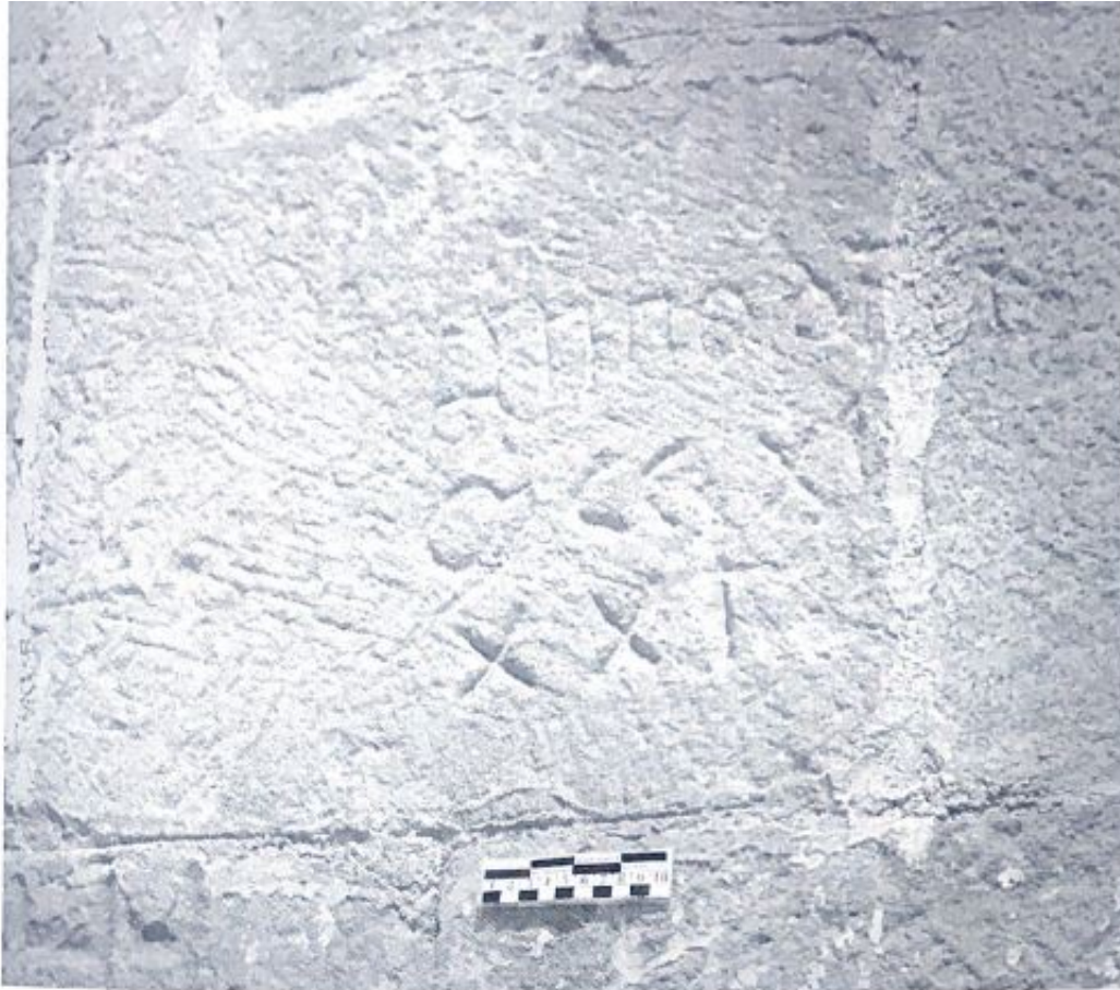
Fig. 127. Inscripción de lado sur de la iglesia.