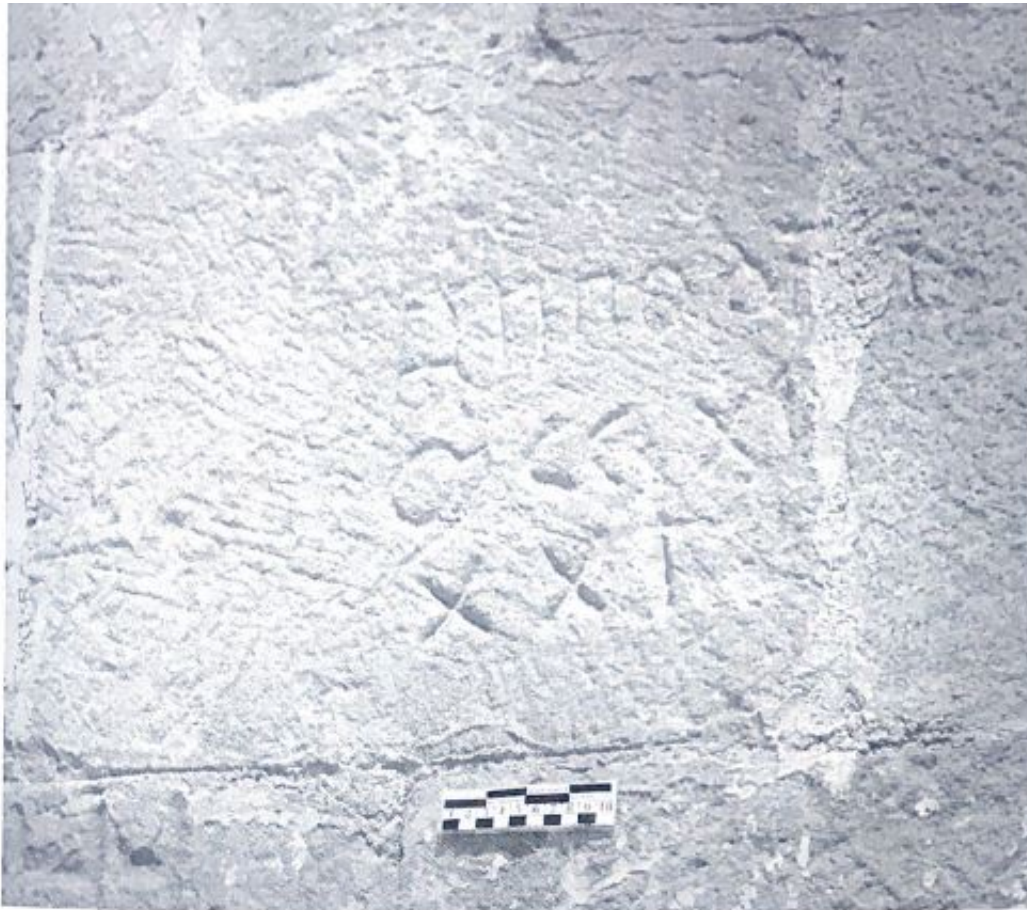
Fig. 127. Inscrición de lado sur de la iglesia.