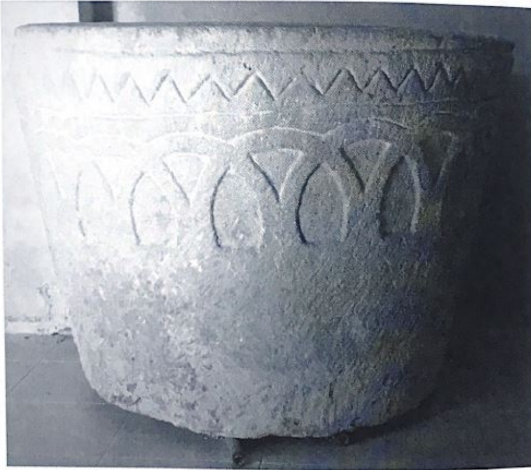
Fig. 137. Pila bautismal de Torrearévalo.