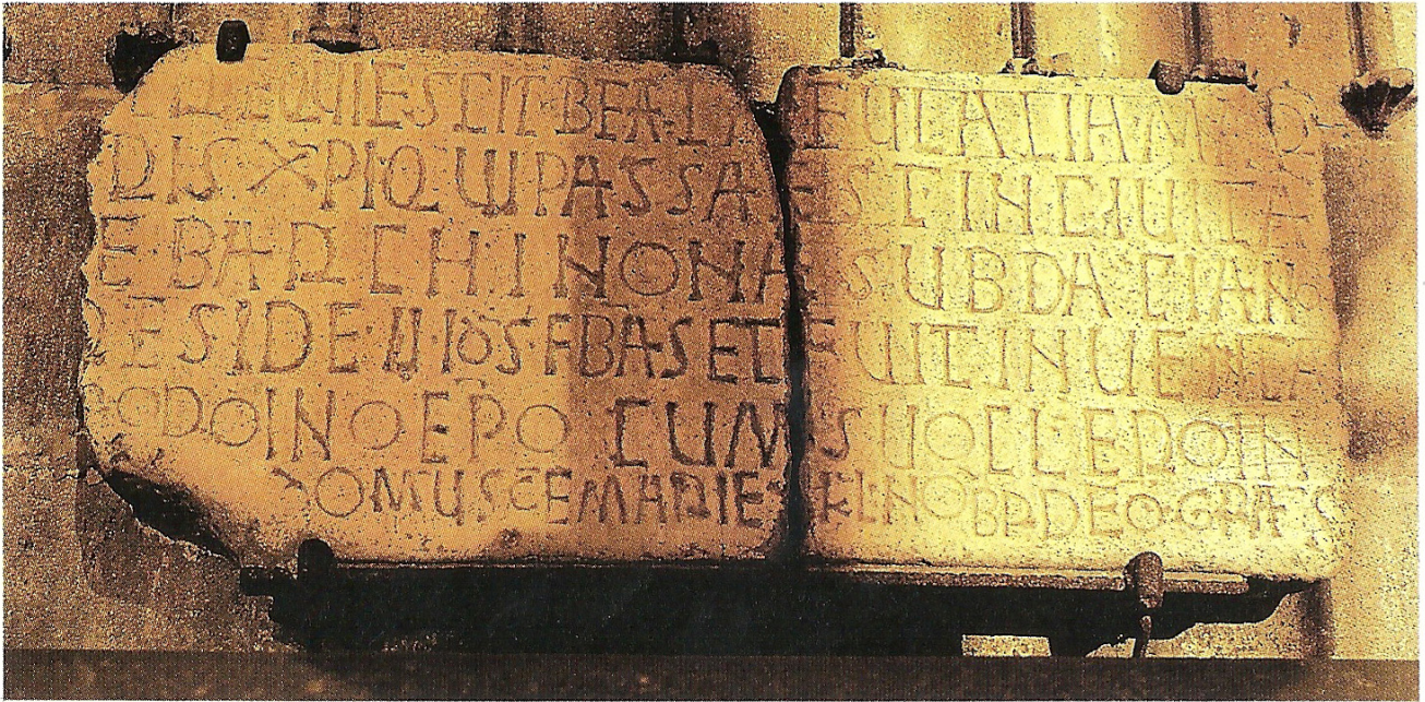
Santa Creu i Santa Eulàlia de Barcelona. Làpida sepulcral dels segles IX-X, dedicada a santa Eulàlia, que es guarda a la cripta de la catedral i dibuix de la mateixa làpida de l'any 1775, publicat a Espanya Sagrada , vol. XXIX, pàg. 314