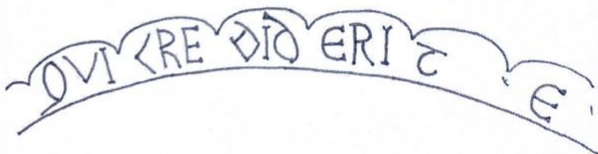
Fig. 145. Dibujo de la inscripción.