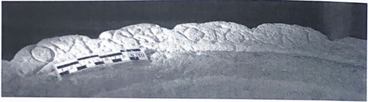
Fig. 144. Inscripción en la boca de la pila.