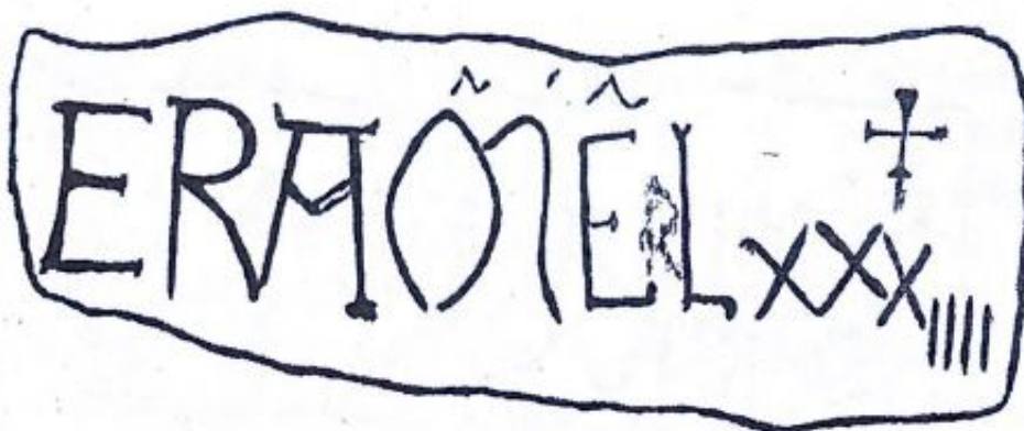
Fig. 152. Dibujo de la datatio según Gaya Nuño (1949).