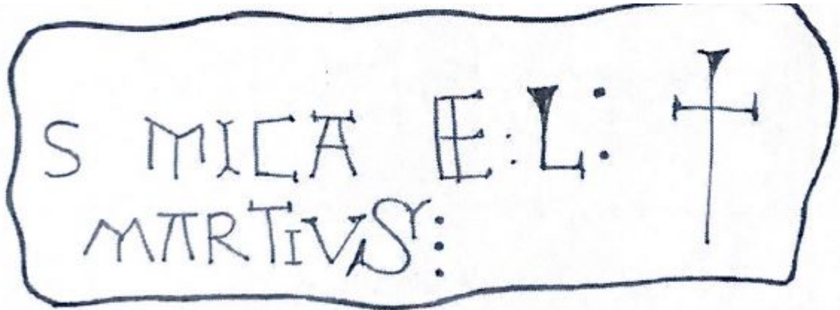
Fig. 148. Dibujo de la advocatio .