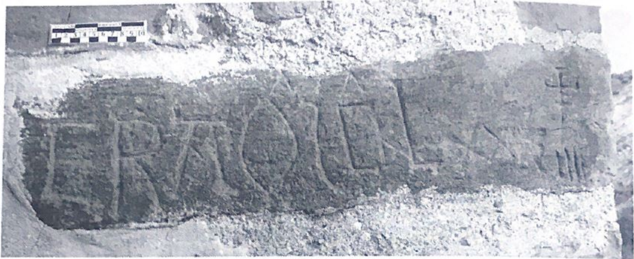
Fig. 150. Datatio .