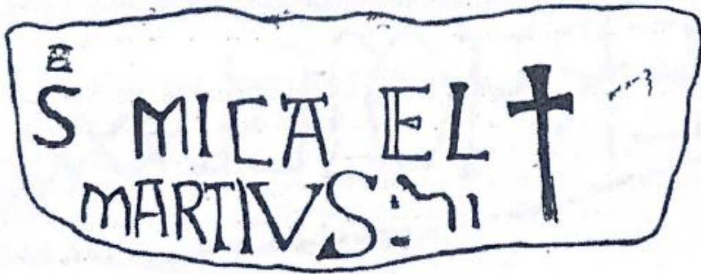
Fig. 149. Dibujo de la advocatio según Gaya Nuño (1949).