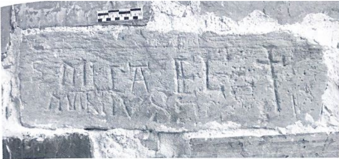
Fig. 147. Advocatio.