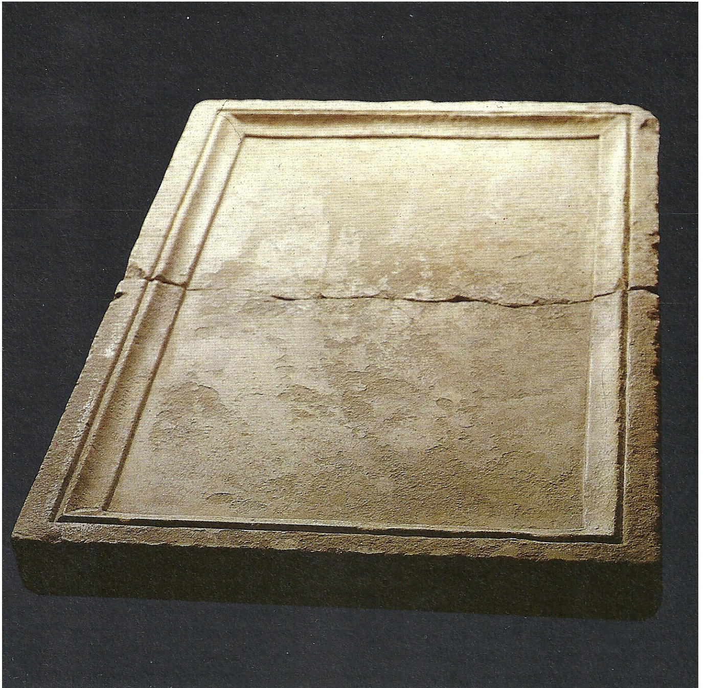
VOL.XII Sant Salvador de la Vedella