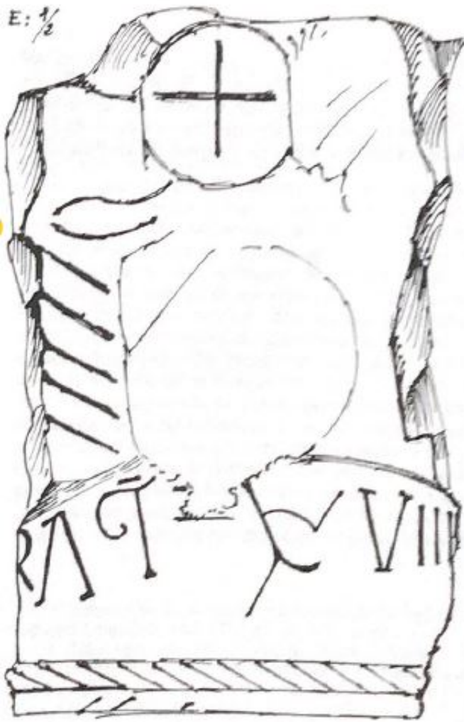
Fig. 3: Capitel o soporte de altar, muy mutilado, aparecido en Santillana de Corvio (fechado en el año 1011)