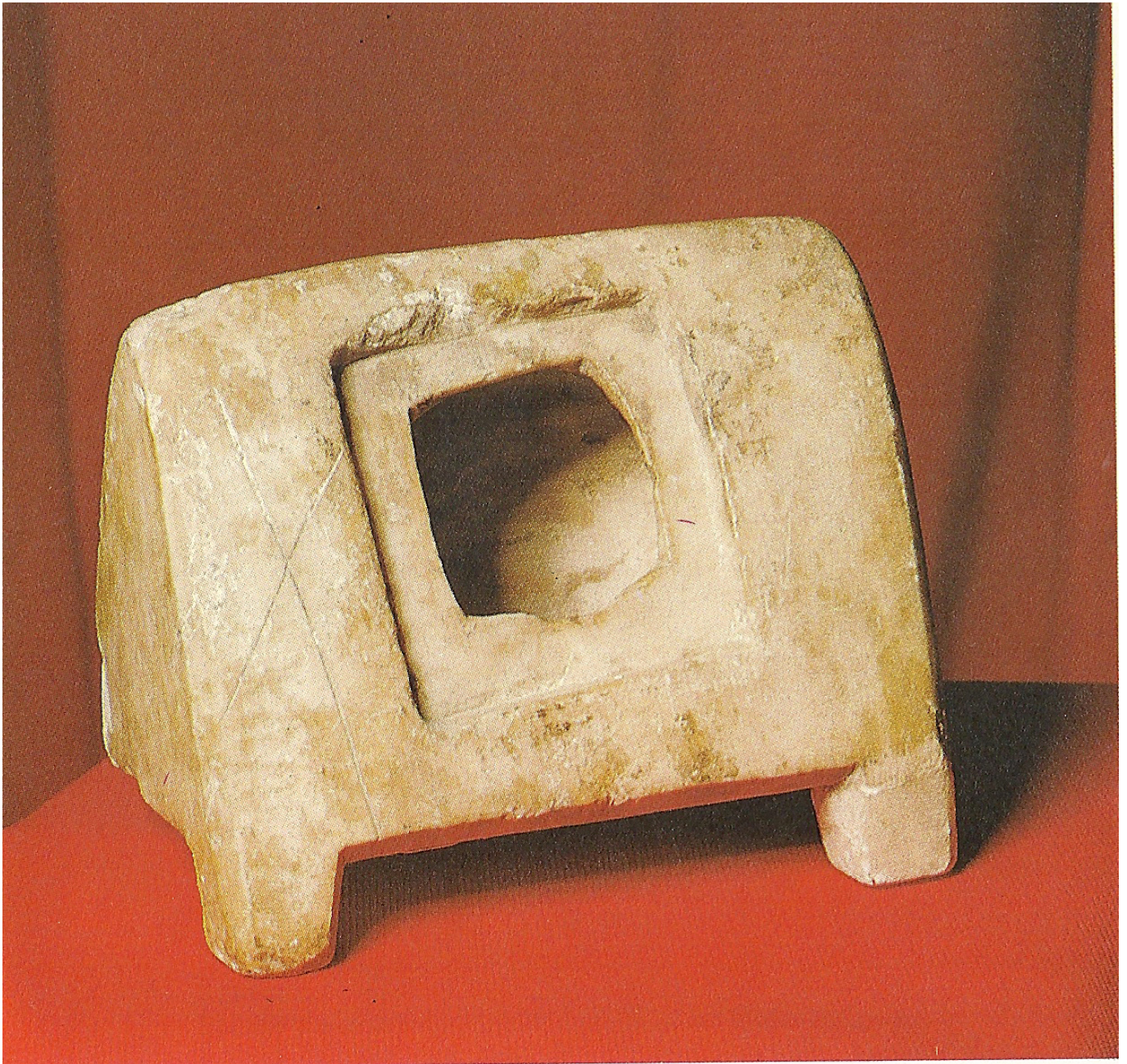
Lipsanoteca 3 (MFMB, 739)