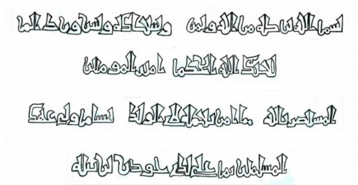
Fig. 3. Epígrafes de las cuatro caras de la arqueta. (Dibujo: Ana Labarta)