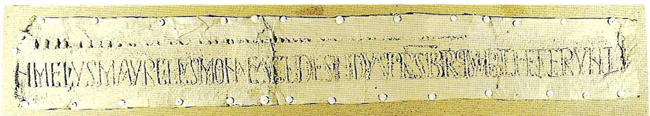
Santa Maria d'Arles inscripción columna