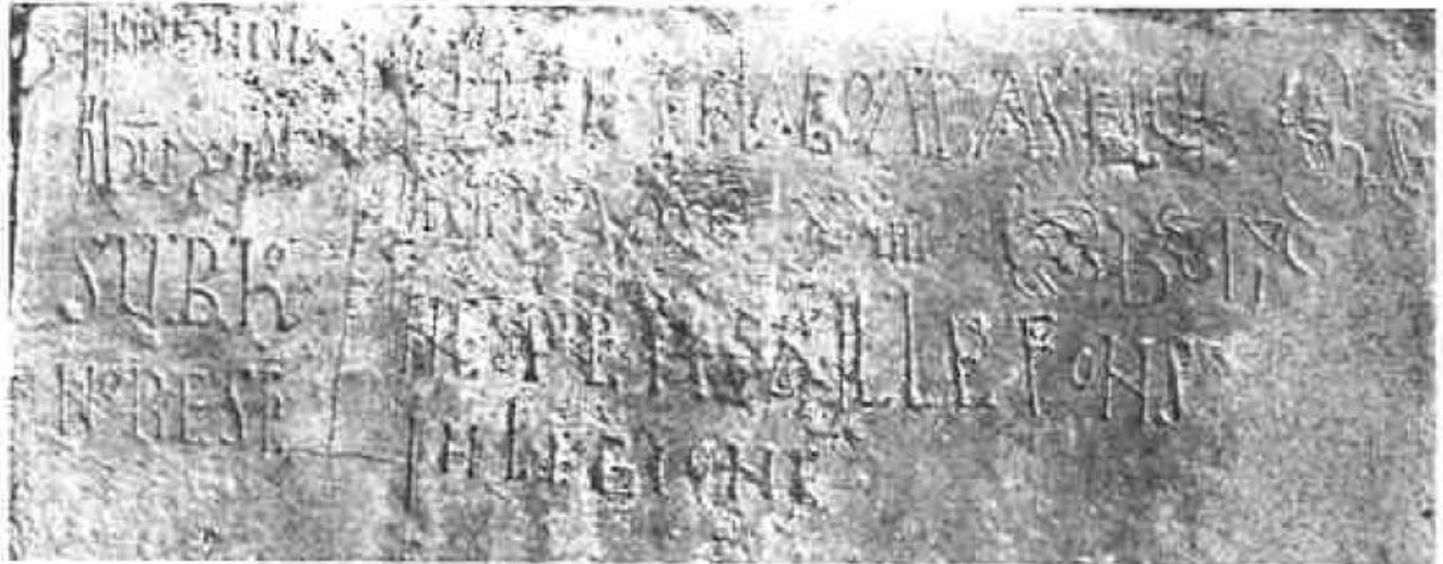
Fig. 4: Consecratio de la iglesia de San Pelayo de Perazancas de Ojeda, Año 1086 (Martín López).