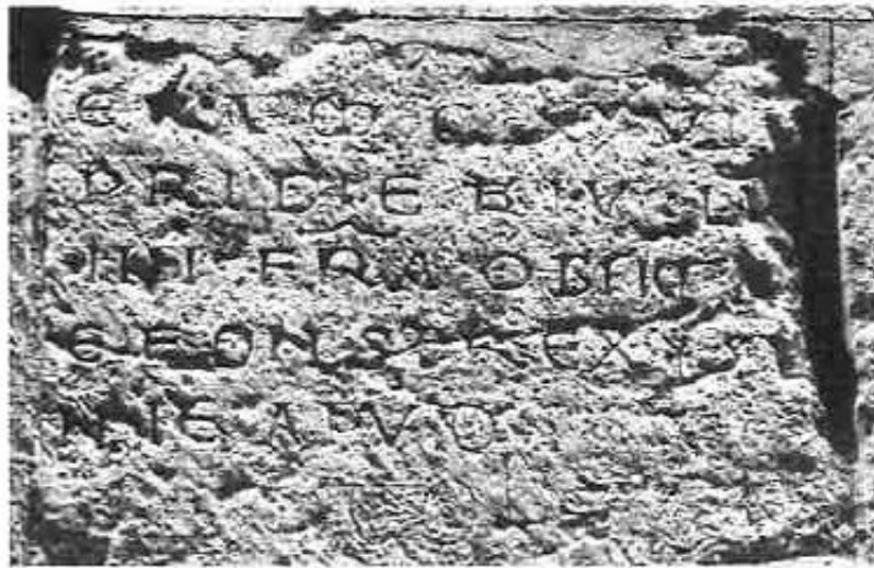
Fig. 7: Epitaphium necrologicum de Alfonso VI en el monasterio de San Salvador de Nogal de Huerta, Año 1108 (Martín López).