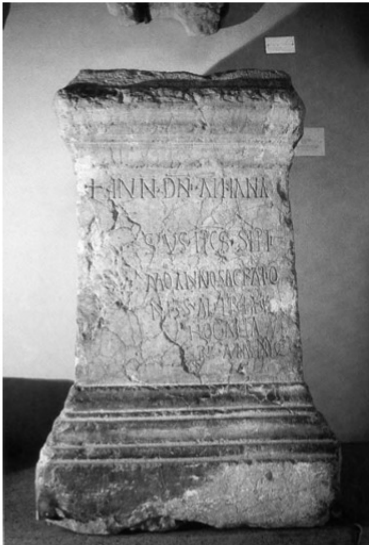
Figura 2. Ara del obispo Anastasio (Xàtiva, Valencia), de Velasco 2000.