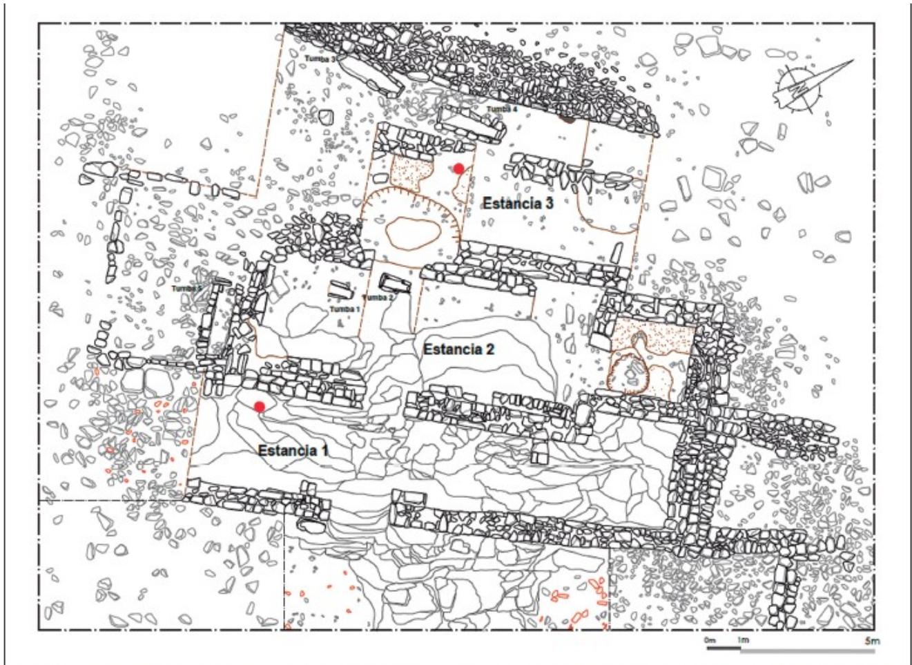
Fig.3. Plano de la excavación de la iglesia de El Castellón, con indicación de los lugares donde se hallaron las pizarras. / Plan of the excavation of the church of El Castellón, with indication of the places where the slates were found.