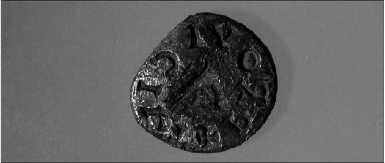
Fig. 5b. Anverso del chatón.