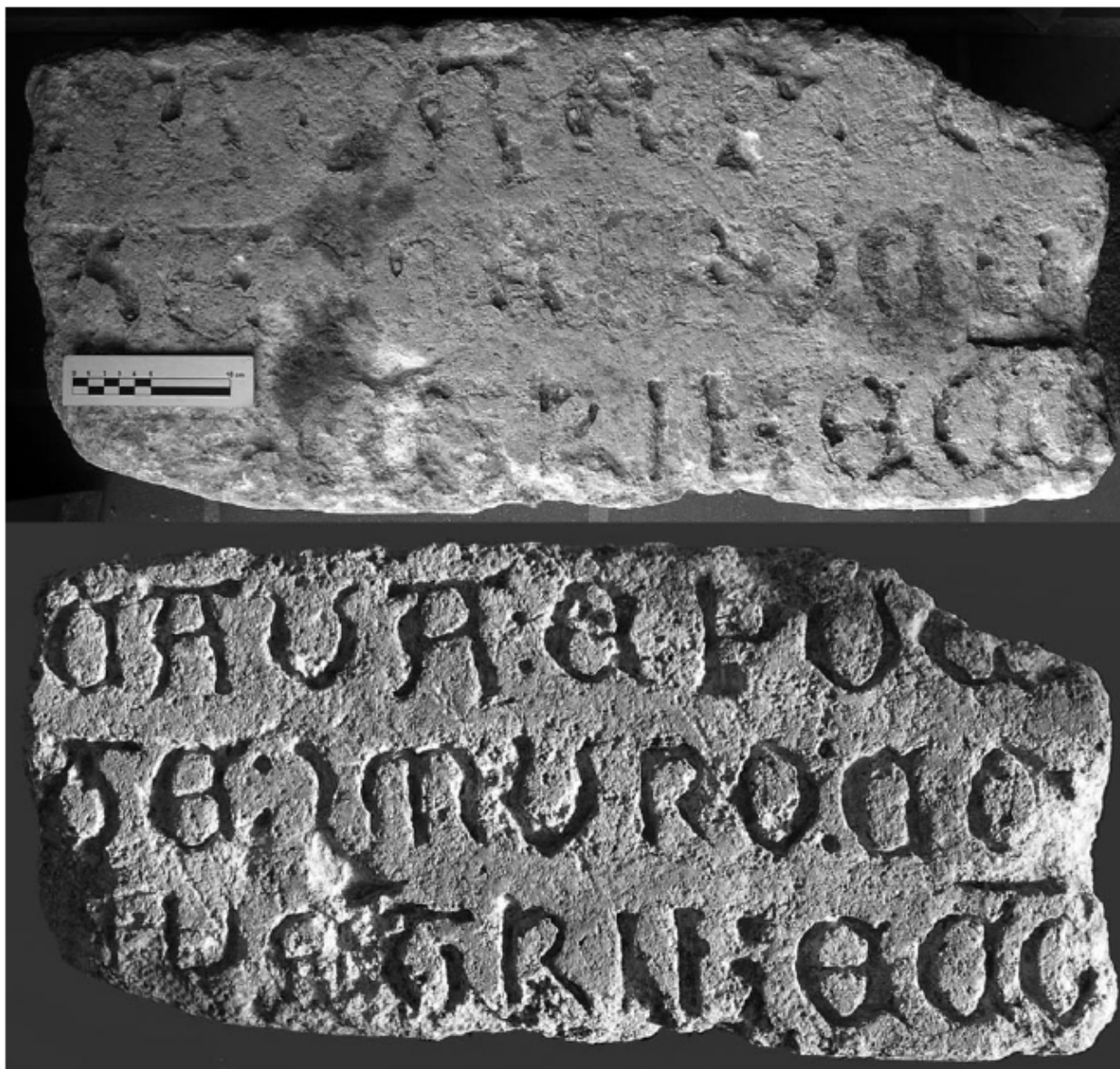
Λám. 7. La inscripción antes y después de la intervención restauradora.