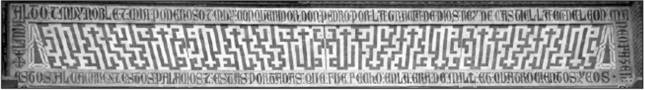
Lám. 13. Inscripción fundacional del palacio mudéjar. Reales Alcázares (Sevilla).