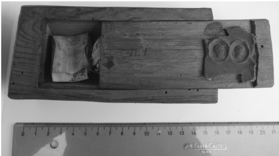
Fig. 1. Lipsanoteca 1 de la Colegiata de Covarrubias