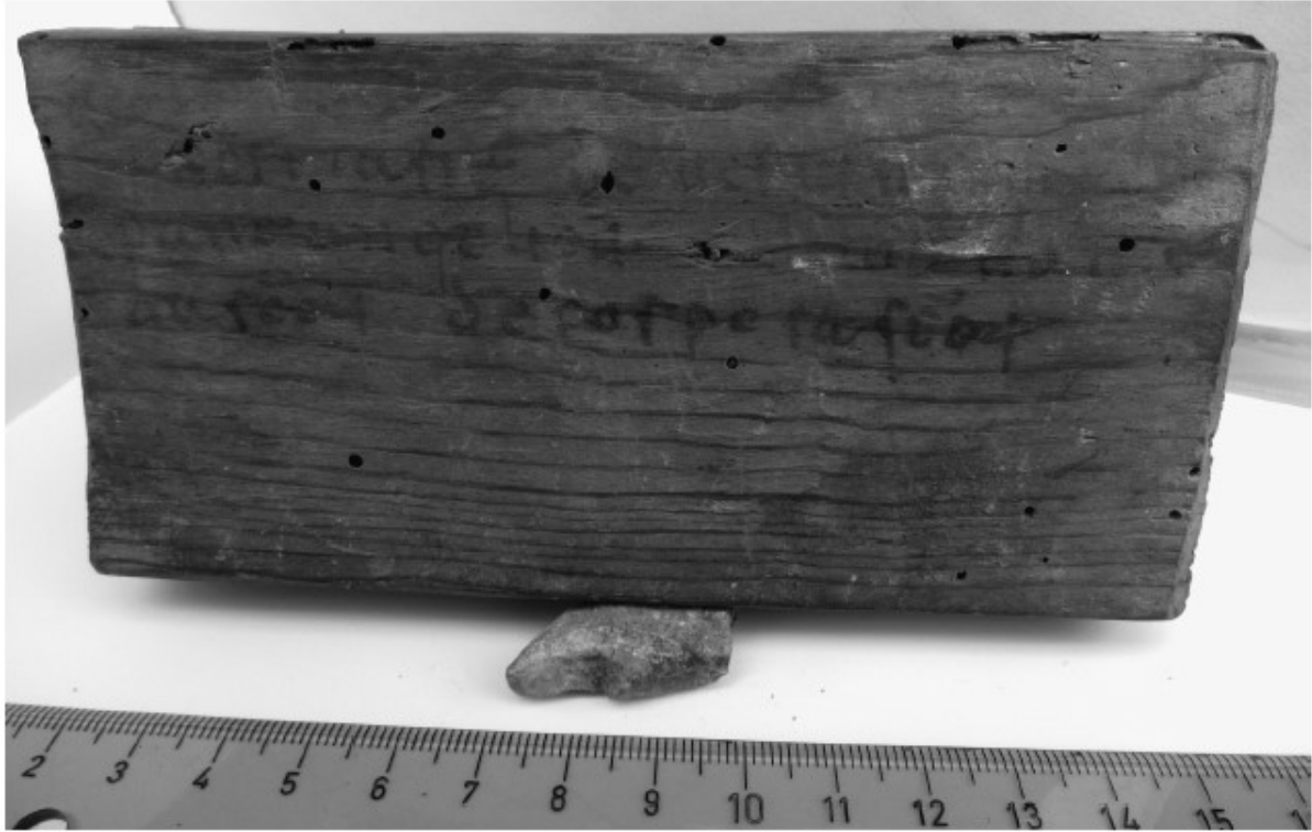
Fig. 2. Inscripción en la base de la lipsanoteca 1 de Covarrubias