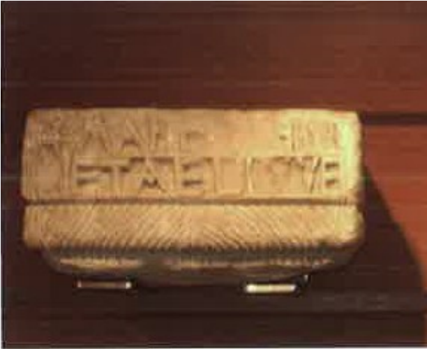
Captura de pantalla 2023-01-103957