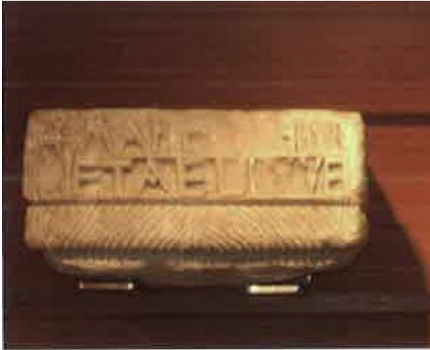
Captura de pantalla 2023-01-103957