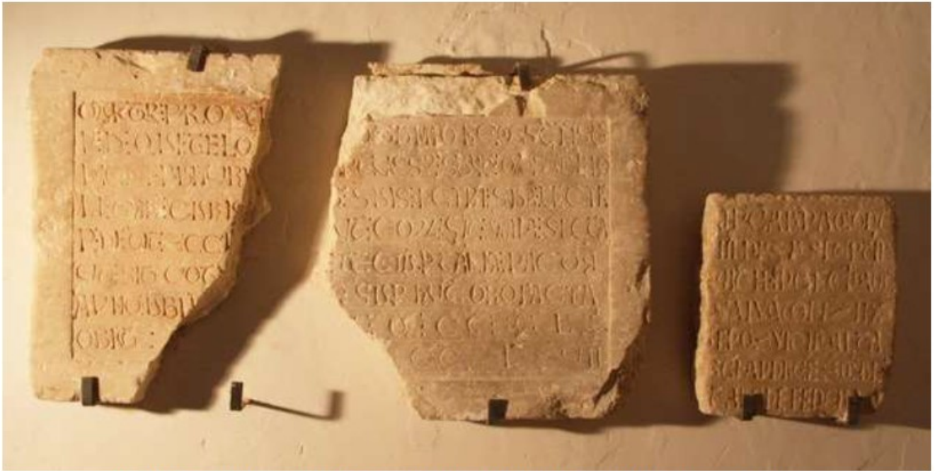
Fig. 2. Dos piedras epigrafiadas medievales (a la derecha, el objeto de estas páginas).