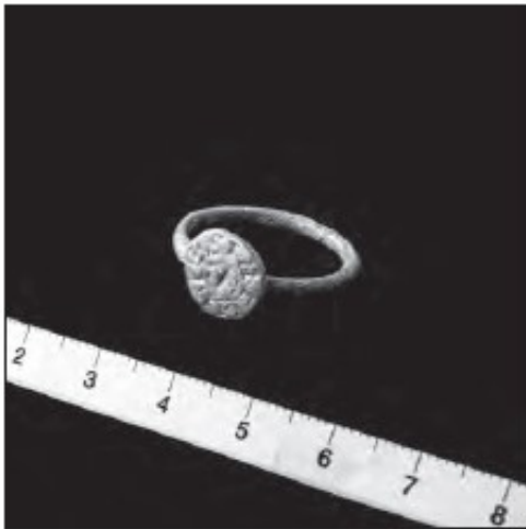
Fig.4. Antillo de La Moraleja, Colmenar Viejo