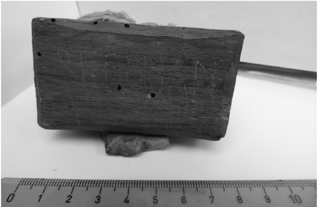
Fig. 6. Cara A de la lipsanoteca 2 de Covarrubias