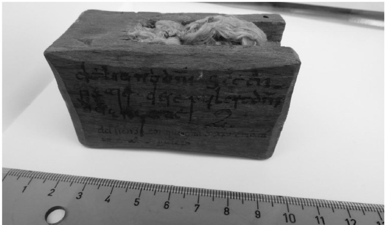
Fig. 5. Lipsanoteca 2 de la Colegiata de Covarrubias