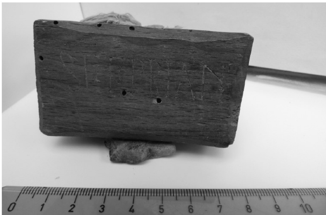
Fig. 6. Cara A de la lipsanoteca 2 de Covarrubias