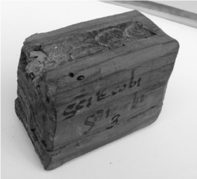
Fig. 8. Lipsanoteca 3 de la Colegiata de Covarrubias