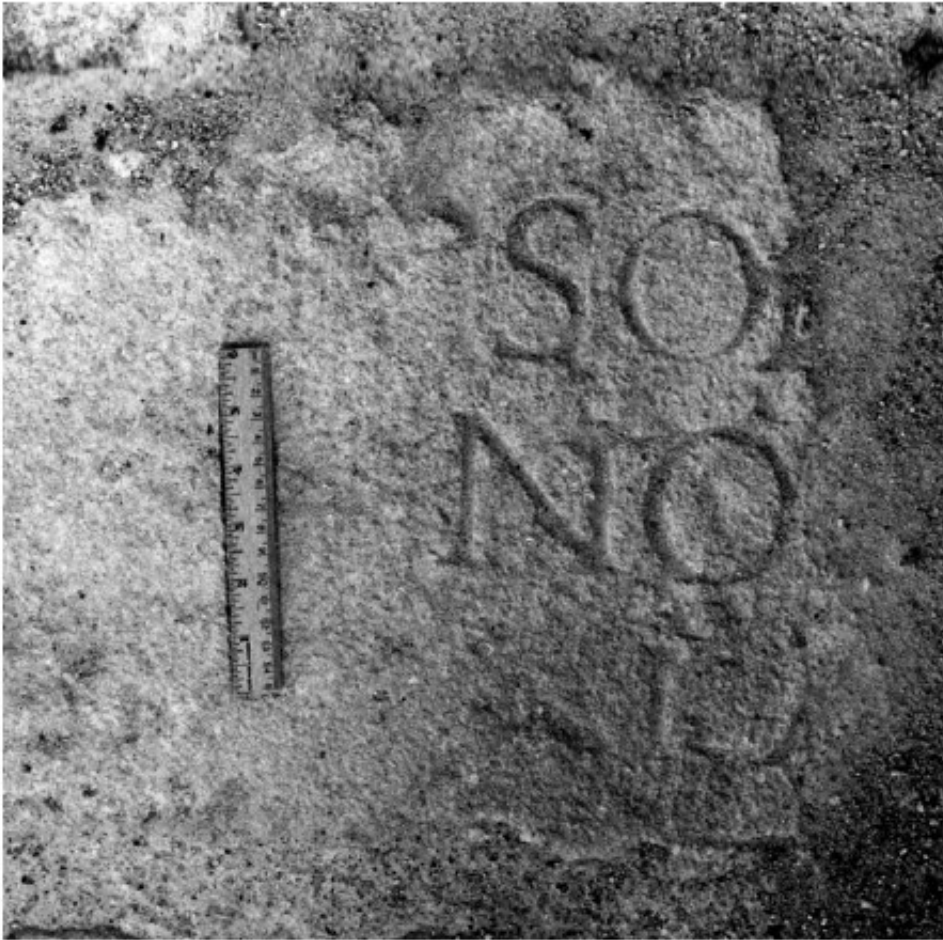
Inscripción de El Arenal: fragmento izquierdo.