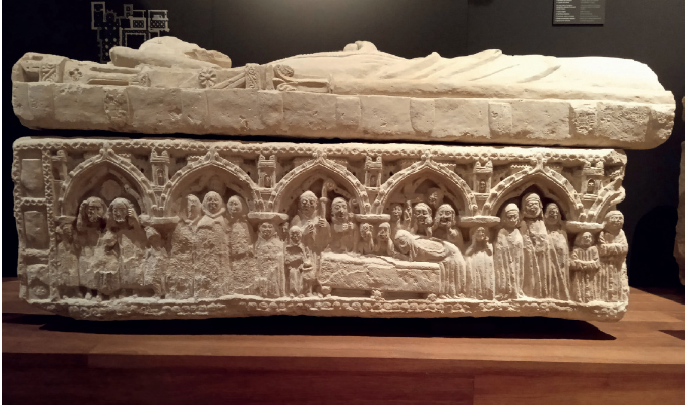
Fig. 5. Sepulcro de Inés de Villalobos.