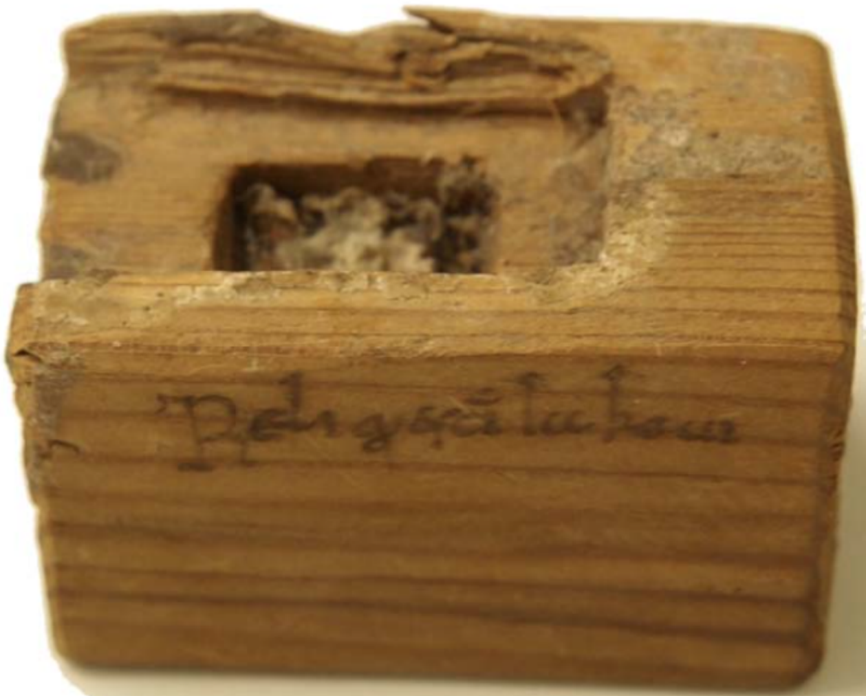
Lipsanoteca de Santiago