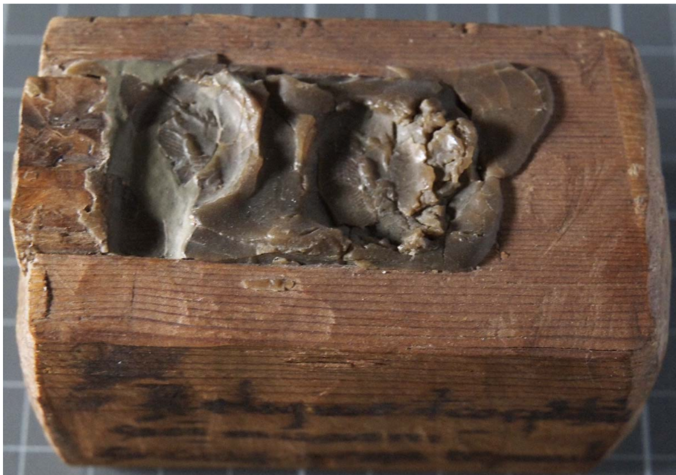
Lipsanoteca de Muro de Solana