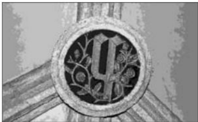
San Pedro 5