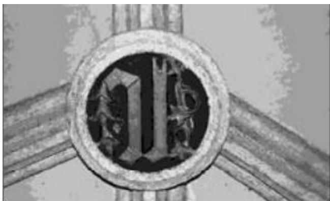
San Pedro 6