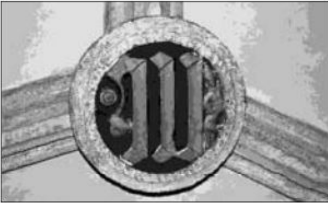
San Pedro 2