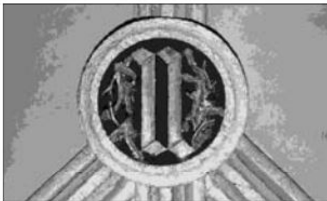
San Pedro 7