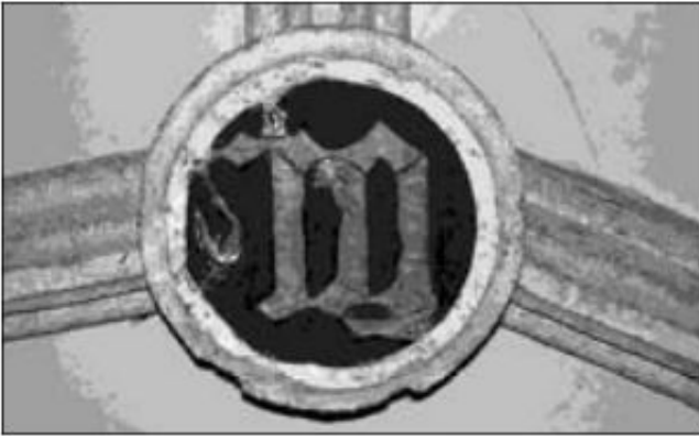
San Pedro 3