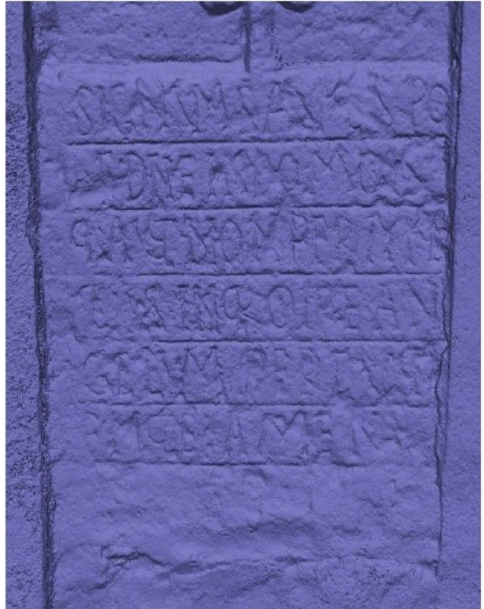
Imagen LE8. Dcha. modelo generado con Agisoft Metashape.