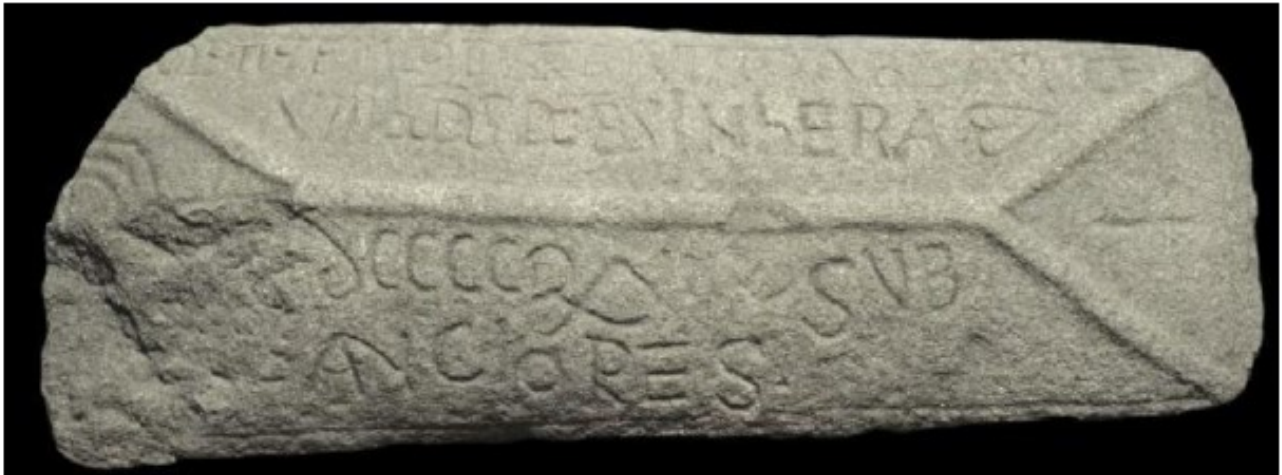
Imagen PO4.