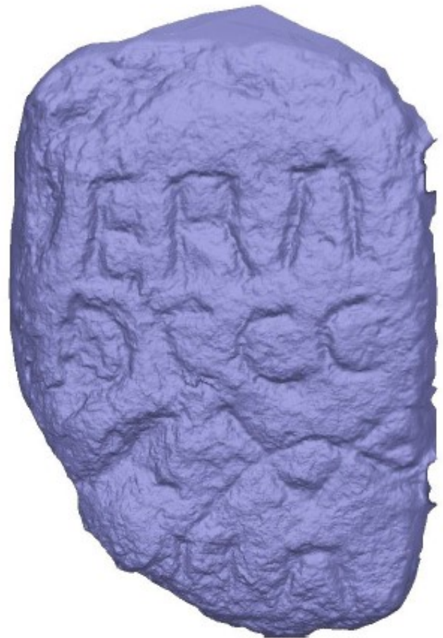
Imagen LU10. Cara b). Dcha. modelo generado con Agisoft Metashape.