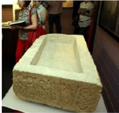
Imagen LU27.