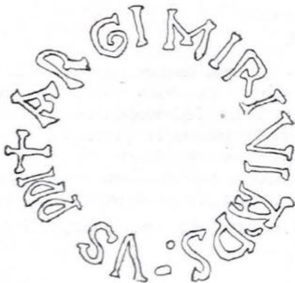
Fig. 19—Patena n.º 8 con el caico de su inscripción (s. Russell Cortez).