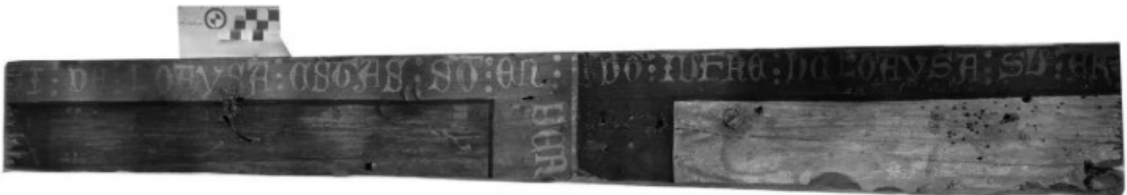
Lam XCVII f CIHM 158