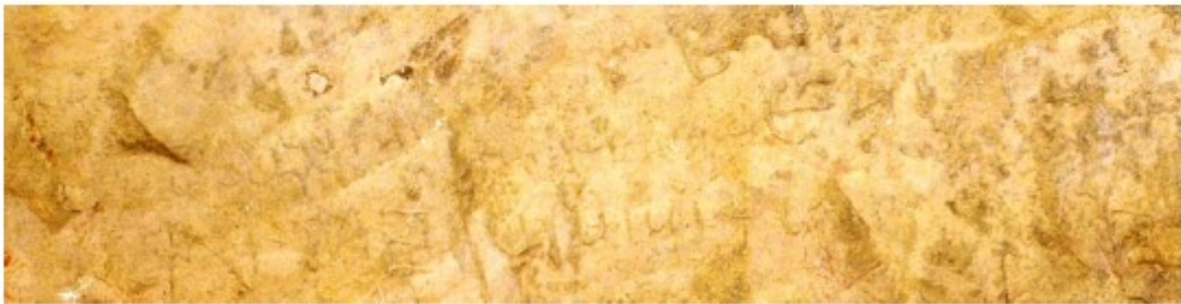
1. c. Intitulationes de la iglesia superior de Las Gobas (Ap. Nº 2)