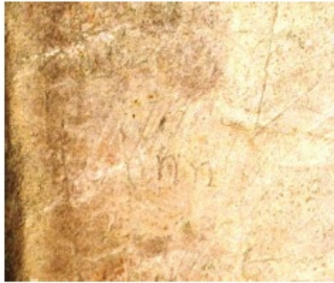
1. b. Intitulationes de iglesia superior de Las Gobas (Ap. Nº 2)