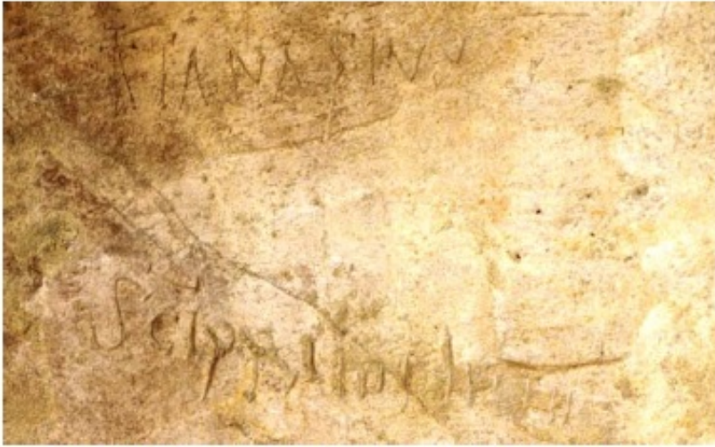
2. a Intitulationes de la iglesia superior de Las Gobas (Ap. N o 2)