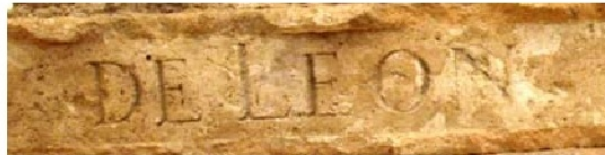
3. b. Epitaphium sepulcrale de doña Jimena. Cardeña (Ap. n.º 45)