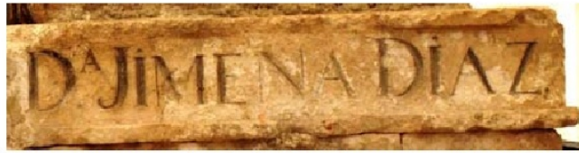
3. b. Epitaphium sepulcrale de doña Jimena. Cardeña (Ap. n.º 45)