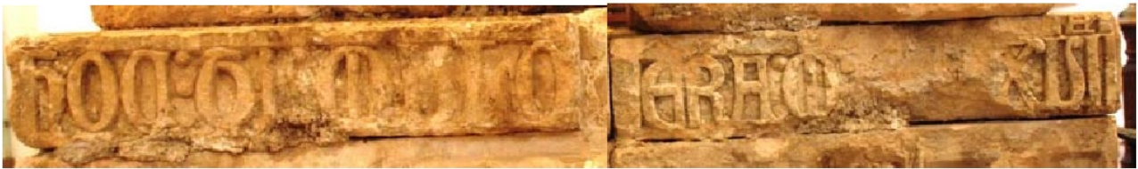
1. a. Epitaphium sepulcrum de Rodrigo Díaz de Vivar. Cardena (Ap. n.º 45)