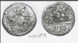
Orose (2ª 4)