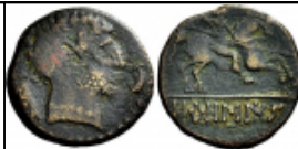
orosiz numisbids Numisbids