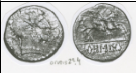
Orose (2ª 4)