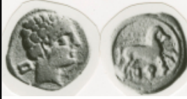
Bursau (2 a 6) Numisbids