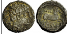
burs numisbids Numisbids