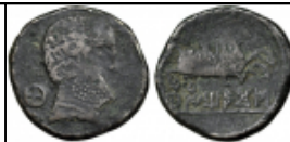
teitiakos numisbids Numisbids