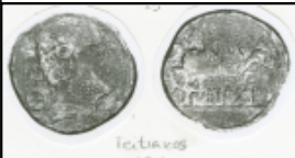
Teitiakos (1ª 1)