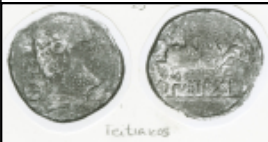
Teitiakos (1ª 1)