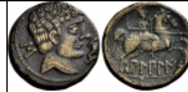
bilbilis s Numisbids