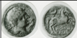
Bilbilis (1ª 2)