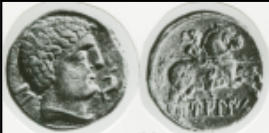
Bilbilis (1ª 1)