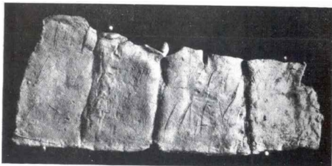
Créditos: Visedo Moltó, 1950