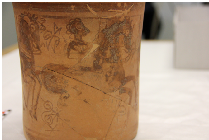
Créditos: Museu de Prehistòria de València_Foto: ALF_junio2014