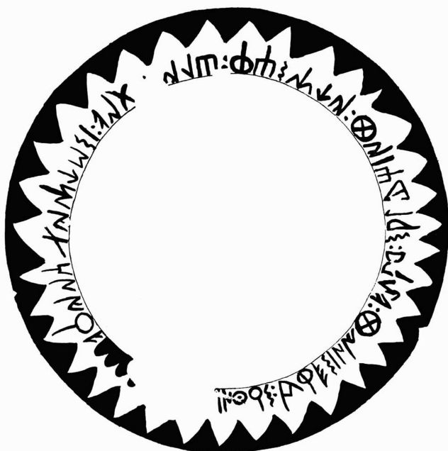
Créditos: Fletcher 1985, fig. 3