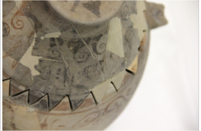
Créditos: Museu de Prehistòria de València. Foto: ALF junio2014