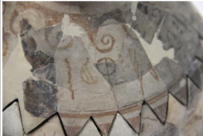
Créditos: Museu de Prehistòria de València. Foto: ALF junio2014